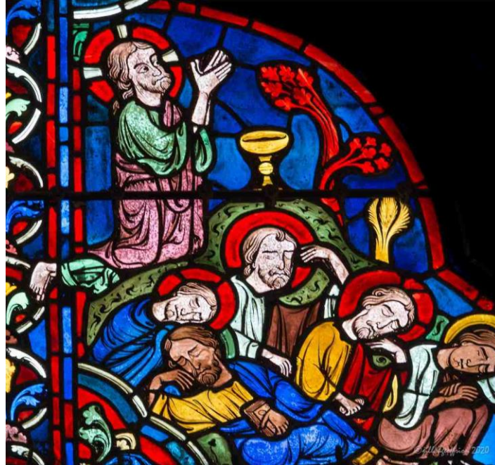
Jésus priant dans le Jardin de Gethsémani (Cathédrale de Chartres, France)

Nous ne pouvons plus suivre Jésus sur le chemin de Jérusalem, comme l'ont fait ses premiers disciples ; et aucun de nous ne peut mourir avec lui sur la croix. Ce n'est pas ce que Jésus demandait. Il nous appelait à le suivre sur le chemin qui mène à la vie. Il nous enseignait à renoncer à notre attachement à nous servir nous-mêmes et à vivre la vie à notre manière, et à le mettre au centre de notre vie et à nous consacrer à le servir, lui et l'Évangile, en acceptant que la souffrance accompagne notre appel. Dans cet acte de "perdre" notre vie, nous la sauverons.