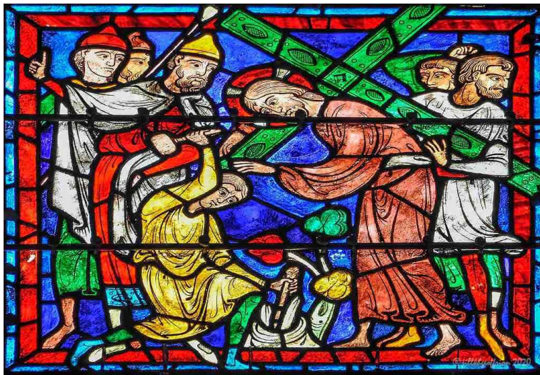
Jésus portant sa croix (Cathédrale de Chartres, France)

Nous ne sommes pas censés chercher la souffrance, mais nous sommes appelés à suivre Jésus. Avec la fidélité à lui viendra la souffrance pour nous. Pourquoi ? Parce que lorsque nous disons oui à Dieu, il y a toujours un prix à payer. Lorsque nous disons non à la tentation, nous pouvons avoir à vivre avec des désirs insatisfaits ou à sentir que nous passons à côté de quelque chose que nous voulons faire ou expérimenter. Lorsque nous choisissons la sainteté et la piété, nous pouvons nous retrouver sans nos béquilles et le (faux) confort qu'elles apportent. Lorsque nous nous consacrons au service du Christ et de l'Évangile, nous devons souvent, ainsi que nos familles, faire des sacrifices. Lorsque nous tenons fermement à notre foi en Christ parmi les non-croyants, nous pouvons avoir à supporter leur hostilité, leur rejet, leur marginalisation, ou pire encore.