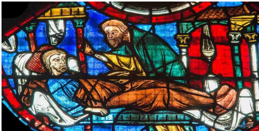
ဓားပြရိုက်နှက်ခံရသူကို ပြုစုပေးနေသော ရှုမာရိလူ (ကောင်းသောရှုမာရိ၊ ချာကြာစ်ကာသီဒရာယ်လ်၊ ပြင်သစ်)

ချစ်ခြင်းမေတ္တာဆိုသည်မှာ နွေးထွေးယုံမျှ၊ ခံစားယုံမျှ၊ သို့မဟုတ် အရုပ်ကလေးဖြင့်ပြသနေယုံမျှဖြင့် မလုံလောက်ပေ။ ဂရုဏာပြုသခြင်းကြောင့် အဖိုးအခပေးရသည်များလည်းရှိနိုင်သည်။ ဓားပြရိုက်နှက်ခံရသောလူနာကို ရှောင်ကွင်းသွားသော ဘာသာရေးဆရာနှစ်ယောက်မှာ ချစ်မေတ္တာအကြောင်း၊ ဘုရား၏ဂရုဏာအကြောင်းကို တွင်တွင်ဟောပြောနေသူများဖြစ်နေနိုင်သည်။ သို့သော်လက်တွေ့ဘဝတွင် တော့ ဒုက္ခရောက်သူကိုမကူညီဘဲ တစ်ဖက်လမ်းမှရှောင်ကွင်းထွက်သွားကြလေသည်။ သို့သော်အနှိမ်ခံအပယ်ခံဖြစ်သော ရှုမာရိလူရောက်လာသောအခါ ထိုလူနာကိုကူညီပေးပြီး ကုသစရိတ်၊ နေရာထိုင်ခင်းနှင့် စားသောက်စရိတ်ကိုပင် မိမိအိတ်ထဲမှစိုက်ထုတ်ပေးလေသည်။ သူလုပ်ဆောင်ရမည့်တာဝန်ကို ခဏဖယ်ထားပြီး ထိုလူနာကိုအချိန်ပေးသည်။ ထိုတင်မကသေး မိမိအလုပ်ကိစ္စပြီးသောအခါ ထိုလူနာရှိရာသို့ တဖန်ဝင်ကြည့်၍ လိုအပ်သည့်အကူအညီကိုထပ်ပေးခဲ့သည်။