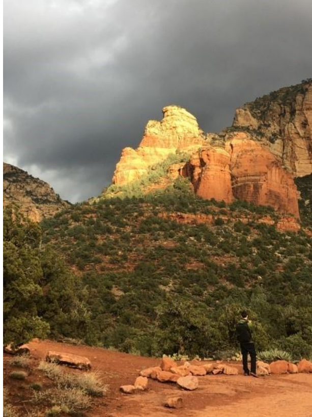
Ánh sáng buổi tối trên những tảng đá ở Rừng quốc gia Coconino, Sedona, Arizona

Chiêm ngưỡng bức ảnh trên. Bạn để ý những gì? Bạn cảm thấy như thế nào? Suy gẫm những lời của Thi Thiên: