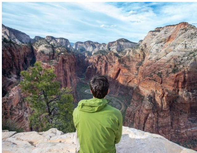
Thiên thần hạ cánh, Công viên quốc gia Zion, Utah, Hoa Kỳ

Trong những khoảnh khắc như thế này, tôi không cầu nguyện cho các giải pháp, chữa lành, hoặc thậm chí là giải cứu. Tôi chỉ tìm kiếm một chút thoải mái, có thể đổi mới năng lực, hoặc chỉ là một khả năng để cảm thấy niềm vui một lần nữa. Và câu trả lời đến. Không thường xuyên ngay lập tức. Tôi cần lắng nghe và đáp lại giọng nói nhỏ nhẹ của Thánh Linh; và trong thời gian, sự giúp đỡ đến. Tôi làm theo lời nhắc để mở Kinh thánh, đứng dậy và đi dạo bên ngoài, tiếp cận với người bạn tốt, nói chuyện với người yêu tôi, hoặc hướng sự chú ý của tôi đến người cần tình yêu hoặc sự giúp đỡ của tôi theo một cách nào đó. Hoặc, có lẽ tôi tìm thấy sự tự do khi chỉ ngồi với nỗi buồn và không cảm thấy bị ép buộc phải cố gắng làm cho mình hạnh phúc, khi tôi chờ đợi Chúa Thánh Linh khôi phục lại sự bình an và niềm vui trong tôi.