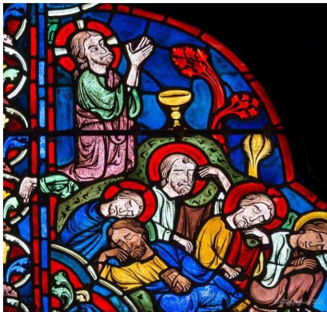
Chúa Giêsu cầu nguyện trong Vườn Ghết-sê-ma-nê (Nhà thờ Chartres, Pháp)

Chúng ta không còn có thể theo Chúa Giêsu trên đường đến Jerusalem, như các môn đệ trước đây của Chúa đã làm; và không ai trong chúng ta có thể chết với Ngài trên thập giá. Chúa Giêsu đã không yêu cầu điều đó. Ngài đang kêu gọi chúng ta theo Ngài trên con đường dẫn đến sự sống. Ngài dạy chúng ta từ bỏ ý riêng trước mắt tập chú vào việc phục vụ bản thân và sống cuộc sống theo cách riêng của chúng ta, và thay vào đó đặt Ngài vào trung tâm của cuộc sống của chúng ta và công hiến để phục vụ Ngài và Phúc âm, chấp nhận rằng đau khổ sẽ đến với sự kêu gọi của chúng ta. Trong hành động này của “Sự mất mát” cuộc sống của chúng ta, chúng ta sẽ cứu nó lại.