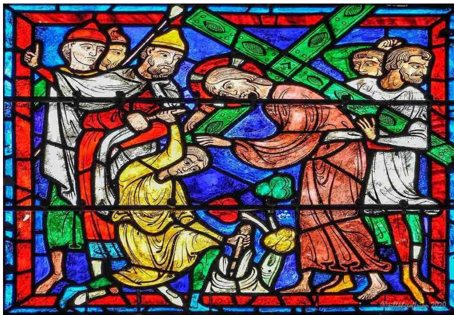
Chúa Giê-su và thập giá của Ngài (Nhà thờ Chartres, Pháp)

Chúng ta không được thúc bách để tìm kiếm đau khổ, nhưng chúng ta được mời gọi đi theo Chúa Giê-su. Với sự trung tín nơi Ngài thì đau khổ sẽ đến với chúng ta. Tại sao? Bởi vì khi chúng ta nói đồng ý với Chúa, ở đó thường có sự trả giá. Khi chúng ta nói không với cám dỗ, chúng ta có thể phải sống với những ham muốn chưa được thỏa mãn hoặc cảm thấy mình đang bỏ lỡ điều gì đó mà chúng ta muốn làm hoặc trải nghiệm. Khi chúng ta chọn sự thánh thiện và tin kính, chúng ta có thể bị bỏ lại nếu không có tai họa và mất đi sự thoải mái (hoặc sai trật) mà chúng mang lại. Khi chúng ta cống hiến hết mình để phục vụ Đấng Christ và Phúc âm, chúng ta và gia đình thường phải hy sinh. Khi chúng ta giữ vững niềm tin vào Chúa Jesus giữa những người không tin, chúng ta có thể phải chịu đựng sự thù địch, từ chối, thiệt thòi, hoặc tệ hơn.