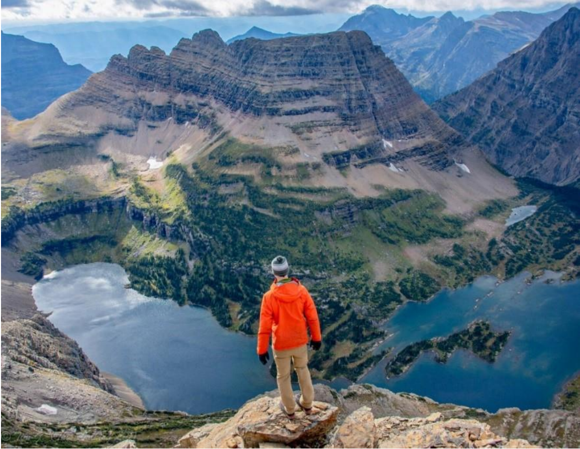
Hồ ẩn, Công viên quốc gia Glacier, Montana