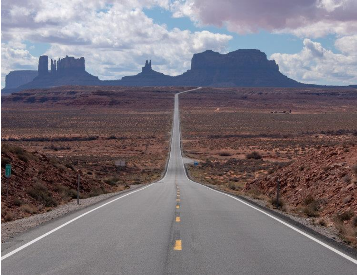
Monument Valley, Utah, USA

Hngal Zungzal: Zumhnak (trust) cu mah nih i thimmi a si.