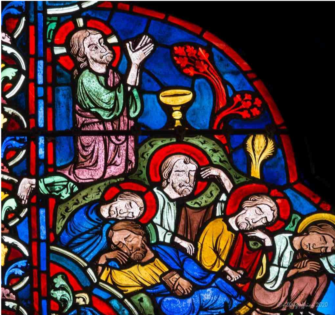
Gethsemane Dum chung ah Jesuh thla a cam lio (Chartres Cathedral, France)

Gethsemane Dum chung ah Jesuh cu hi ti hin thla a cam: