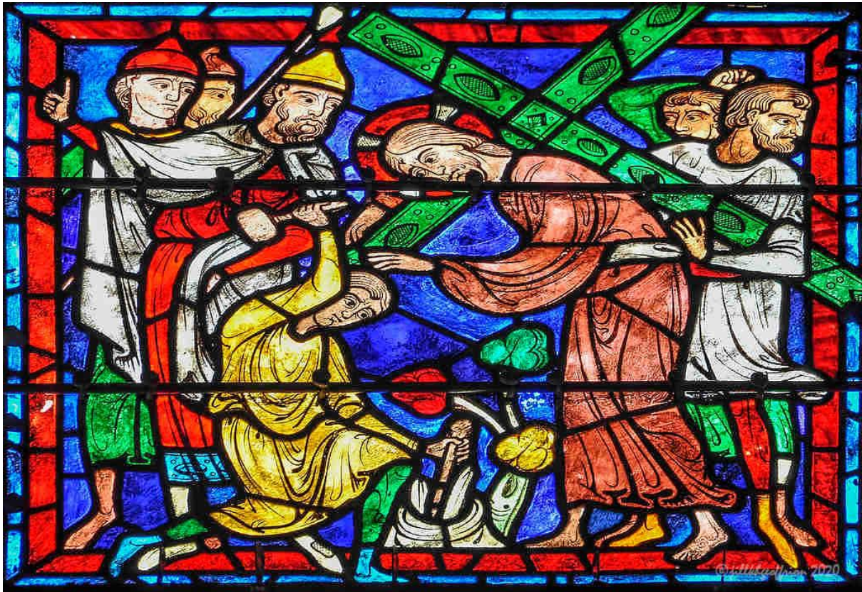
Jesuh nih vailamtung a put lio (Chartres Cathedral, France)

Khrih le a thawngṭha ca i kan i pek tik ah, pumpak in siseh, kan chungkhar in siseh, thawi (sacrifice) a haumi a um. Khrih chung i fek tein kan dir tik ah, zumlotu hna sin in ralnak, hnonnak, pheonak le cu nak in a faak deuh mi a dangdang zong kan ton a hau.